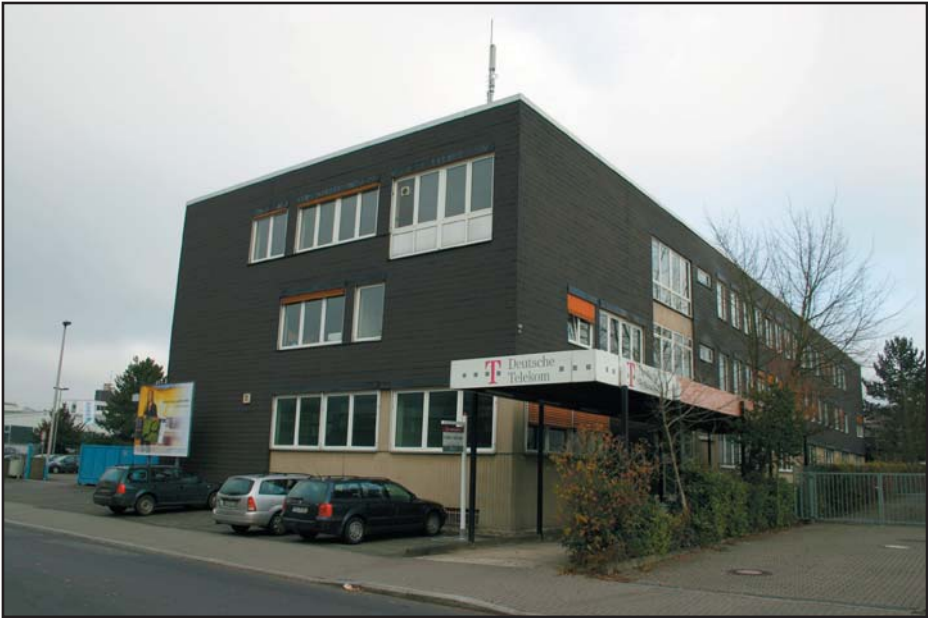
Das „Bildungswerk der hessischen Wirtschaft“ residiert in diesem heruntergekommenen ehemaligen Telekom-Gebäude in der Temmlerstr. 3

sen zu sein. Was macht man denn nun mit den vielen Menschen, die sich der legitimen Verfügbarkeit durch Arbeitsverträge zur Verfügung stellen wollen? Man verschärft die Prüfung ihres Willens! Aus diesem Grunde gibt es diese Trainingsmaßnahmen.