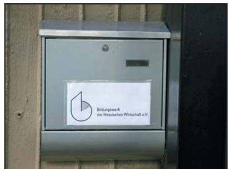
hier eine „Briefkastenfirma“

blick auf den Datenschutz als auch was die Würde des Einzelnen anbelangt, äußerst problematisch. Weigert sich ein Teilnehmer, an den „Übungen“ teilzunehmen, sind Abmahnungen durch den Kursleiter möglich, die schließlich zur Sperrung des Arbeitslosengeldes oder der Arbeitslosenhilfe führen können. Auch die Praxis des Bildungswerks der Hessischen Wirtschaft, die unfreiwilligen Kursteilnehmer zur Unterzeichnung eines „Schulungsvertrages“ zu nötigen, mutet rechtlich sehr fragwürdig an. Dies vor allem auch wegen der im Vertrag enthaltenen Klausel, dass die Kosten des Lehrganges „in der Regel“ vom Arbeitsamt übernommen werden. Dem-