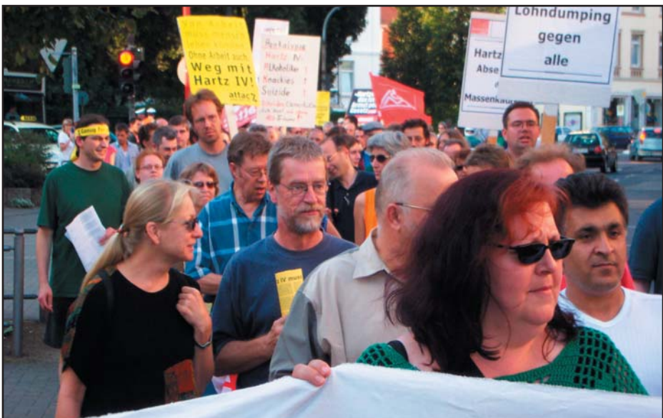
Bilder auf den Seiten 28-30: Montagsdemonstrationen in Marburg

Damit landen wir bei frühkapitalistischen Verhältnissen. Denn die ZwangsarbeiterInnen haben keine festen Arbeitszeiten, kein Streikrecht und für sie gilt auch nicht die Unverletzlichkeit der