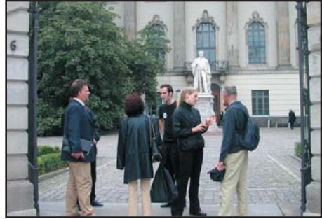
Privatisierung der Berliner Museen: McKinsey feiert, 27.08.2004

dienender Arbeitskraftunternehmer, die wenig Zeit haben. Ihr Einkommen müssen sie allerdings verstärkt zum Erhalt ihrer Beschäftigungsfähigkeit einsetzen. Ebenso geht es für die private Vorsorge gegen eventuelle Risiken drauf. Der Staat kann die Bereitstellung von Versicherungen und Bildungsangeboten nur auf einem abgespeckten Niveau bieten. Da die Industrieunternehmen einerseits auf den Binnenmarkt kaum Rücksicht nehmen müssen, andererseits vielfältigste Standorte für sie in Frage kommen, können sie nur gehalten werden, wenn die Standortbedingungen attraktiv sind. Die Attraktivität ist in diesem Bereich weniger eine Frage der Löhne, die sie zu zahlen haben, sondern ob sie wenig Steuern zahlen müssen und trotzdem eine gut ausgebaute Infrastruktur zur Verfügung gestellt wird. Den Staat, der dies kann, haben ausschließlich die neuen Arbeitskraftunternehmer zu finanzieren. Bei dieser Finanzierung gilt es, sie zu entlasten. Sie müssen weniger Sozialabgaben bezahlen können und gleichzeitig mehr dafür bekommen. Durch Kürzung und Umschichtung der Mittel, die bisher an Arbeitslose ausgezahlt wurden, sollen die zeitlich total eingespannten